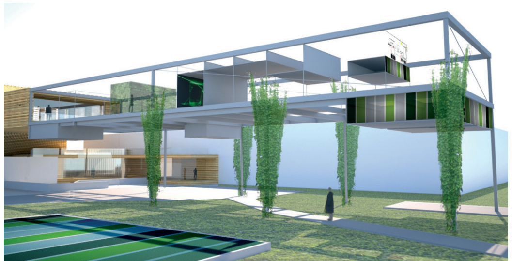
Vårt nye nullutslippslaboratorium skal vere ein «Living Lab» og forskinga skal gi oss svar på kva som må til for å oppnå gode kontor- og undervisningsarbeidsforhold i ein ZEB-bygning. Illustrasjon: Snøhetta

ZEB Flexible Lab skal vere så fleksibelt at vi enkelt kan bygge om for nye løysningar av tekniske installasjonar, romutforming og klimaskjerm. Styrings- og målesystema som skal inkluderas, vil vere komplekse. Vårt mål er at ZEB Flexible Lab blir eit objekt for risi-