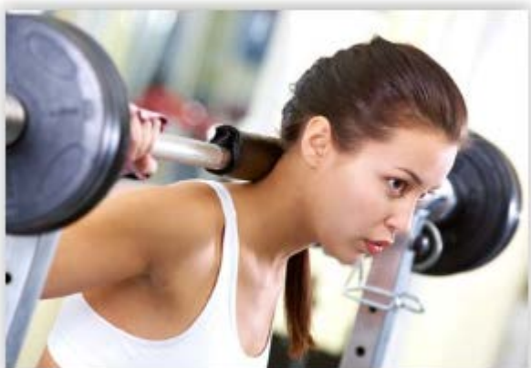
Bilde 3. "Positivt selvbilde og kroppsbilde er #goals"