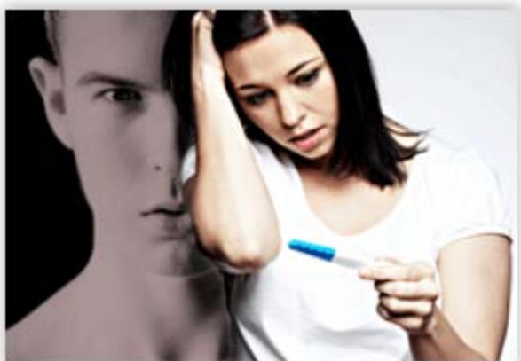
Bilde 1. "Kjæresten er gravid"

Teksten inneholder ingen åpning for at gutten også kan føle glede eller spenning over at kjæresten er gravid. For gutter skal uplanlagte graviditeter være "krise", "sjokk", "fortvilelse", "sinne", "redsel" og så videre.