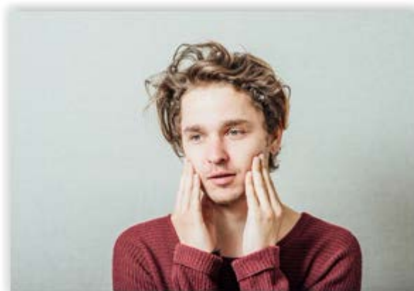
Bilde 2. "Skal jeg bli pappa – eller ikke?"