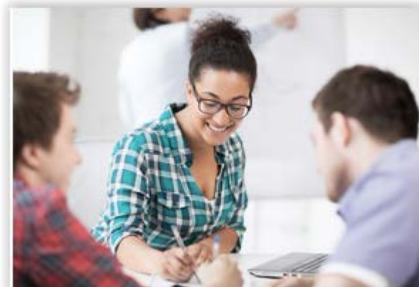
Bilde 4. "Slik finner du informasjon om utdanning" (ung.no, 2019a)

Hvordan kjønn gis mening gjennom ung.no, kan dermed gjennom denne korte gjennomgangen indikeres å være trehodet: For det første fremstår kjønn i vår gjennomgang nærmest som et ikke-tema, gjennom den nesten konsekvente tilnærmingen til leser som "du". Hvordan kjønn gis mening for leser gjennom slike tekster, vil avhenge av hva leseren leser inn i dem: For noen kan disse redaksjonelle tekstene tenkes å virke avkrefte i forhold til kjønnsstereotyper eller kjønnede mønstre i de problemstillinger som behandles. For andre lesere kan slike tekster fungere som blanke ark, som de selv implisitt kjønner fra egen erfaringshorisont – utenfor ung.no. sin kontroll. For det andre løftes også mangfoldet av kjønnsorienteringer fram på nettsiden. Dette skjer særlig under temaene "Homofil", "Kjønnsidentitet" og Likestilling/Diskriminering. For det tredje fremstår kjønn tidvis som stereotypisk og heteronormativt behandlet, i samvirke med kulturelle idealer for kjønnsroller, kropp og utseende.