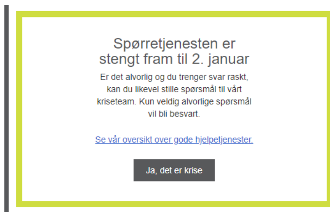
Bilde 5: Skjermdump fra ung.no desember 2018

Slik spørretjenesten på ung.no driftes i dag, er den stengt for de fleste henvendelser store deler av juli og siste del av desember. De møtes da av meldingen "Spørretjenesten er stengt. Er det alvorlig og du trenger svar raskt, kan du likevel stille spørsmål til vårt kriseteam. Kun veldig alvorlige spørsmål vil bli besvart." Og en knapp med påskriften "Ja, det er krise." (bilde 5) Det er kjent fra andre hjelpetjenester, som Kirkens SOS, at pågangen er ekstra stor nettopp i ferier og høytider. Det er liten grunn til å tro at barn og unge har færre spørsmål og problemstillinger de søker svar på i disse periodene. Det kan tvert imot være at nye problemstillinger oppstår for barna/ ungdommene spesielt i ferietid, som de trenger hjelp til å plassere, særlig knyttet til relasjonen til foreldre og familie, alkohol, misbruk, vennskap osv. I ferier vil i tillegg mange signifikante voksenpersoner, så som helsesøster, lærere, skolerådgivere, være utilgjengelige. Det kan derfor være viktig for mange barn og unge å få stilt spørsmålene sine. For noen vil det ha en positiv effekt bare å få skrevet ned tankene sine.