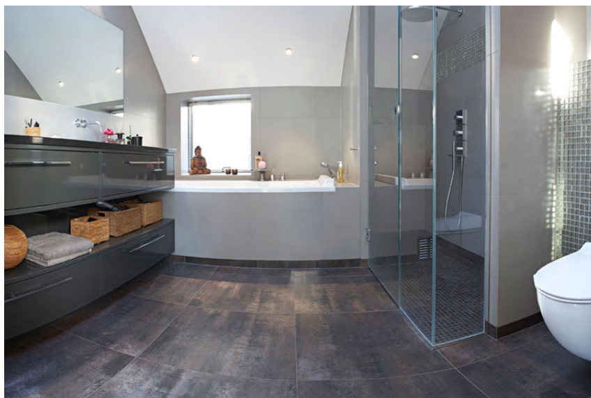
Figur 5: Våtromsgolv får forskjellig vannpåkjenning, avhengig av romstørrelse, innredning, fallforhold, noe som må tas med i vurderingen av utbedringstiltak. (Illustrasjonsfoto)