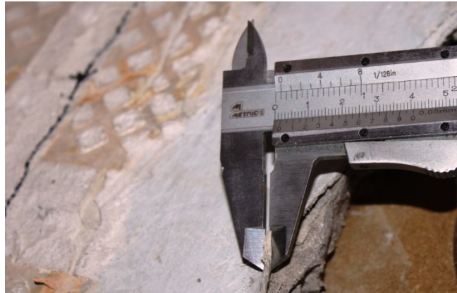
Figur 4: I undersøkelsene inngår vurdering av membranens tilstand bl.a tykkelse, fabrikk og alder.