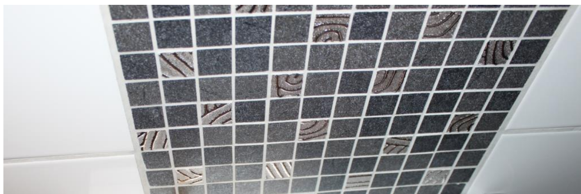
Figur 3: Hvor erstatningsfliser med samme farge er vanskelig å framskaffe kan bruk av helt forskjellige produkter være beste løsningen.

Som alternativ til å finne fliser som er nesten lik den som skal erstattes kan man få til vellykkede utskiftingsløsninger ved å velge helt andre flisfarger og lage kontrastfelt som gir flaten variasjon. Mange oppfatter slike variasjoner som en kvalitetshevning. Eksempelvis kan mosaikkfelt fungere som et dekorativt parti. Slike løsninger kan være et godt alternativ til forsøk på å finne erstatningsfliser som kanskje uansett vil bli synlig f.eks. på fugemassen.