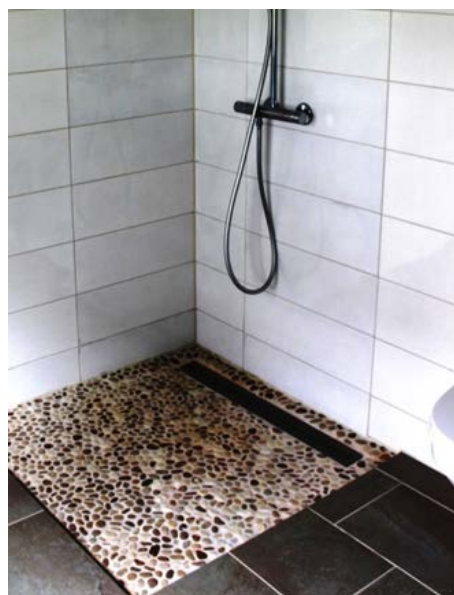
Figur 4: Opptrer markerte fargeforskjeller i en dusjsone kan flis- på- flis være løsningen framfor å skifte fliser med risiko for skade på membranen.

Forsøker man å skifte ut fliser i de mest vannpåkjenne områdene på badet er risikoen tilstede for at påstrykningsmembranen under flisen kan bli skadet og er vanskelig å utbedre, spesielt på vegger. Et alternativ for å skjule utseendemessige mangler er å legge ett nytt flislag oppå eksisterende. Nye veggfliser kan avsluttes mot en naturlig kant f.eks. hjørne og glassdusjvegg som dermed gjør overgangen lite synlig. "Flis- på- flis"-alternativet brukes også på golv med manglende fall for å justere fallvinkelen på overflaten så vannet finner veien til sluket.