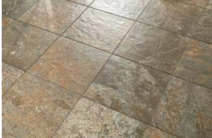
Figur 2: Fliser med store fargevariasjoner merkes med koder som forteller om omfanget av fargespill.

Av og til kan det ferdige resultatet være forskjellig fra slik flisen fremsto i butikken. Hvor store fargevariasjoner som her kan opptre er vanskelig å standardisere. Noen produsenter å operere med fargevariasjonskoder, hvor høyere tall betegner mer fargevariasjon. Slike koder representerer en fargevariasjonsskala og har ikke noe med kvalitetskala å gjøre.