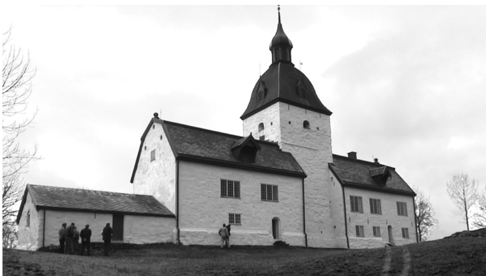
Fig. 5.2 a

Mørteltypene KK_H 1:1:5 og KK_H 1:1:6 (hydratkalk, hydraulisk kalk og sand i volum) er vanlige blandinger i utvendig puss, se eksempel i fig. 5.2 a. Ved omfuging/spekking av murte vegger i værutsatte strøk er det imidlertid nødvendig å benytte en mørtel med større frostmotstandsevne og en blanding med hydraulisk kalk som eneste bindemiddel, for eksempel K_H 1:3 kan anbefales, se fig. 5.2 b.