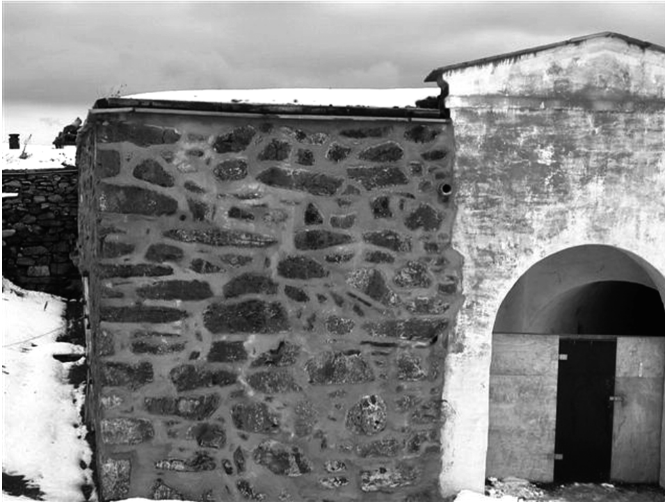
Fig. 5.2 b Festningsmur under omfuging/rehabilitering Mørtel K_H 1:3 benyttes.

I Danmark benyttes hydrauliske kalkmørtler spesielt på værutsatte fasader, sokler, horisontale trekninger o.l. De vanligste blandingene er KK_H 1:1:6 og 1:2:9 og K_H 1:3. Man har der erfaring med det kan være vanskelig å kalke på en hydraulisk kalkpuss. Sandkalk (våtlesket hydratkalk (kulekalk) og fin sand blandet i forholdet 4:1) kan ikke brukes til dette formålet. Man bruker i hovedsak den samme hydrauliske kalken i Danmark som i Norge.