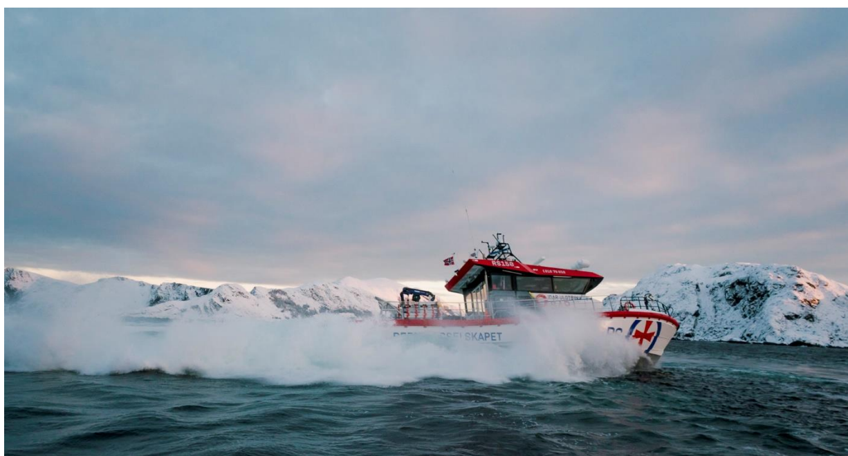
Figur 1 Redningsskøyta Ivar Ulstein.