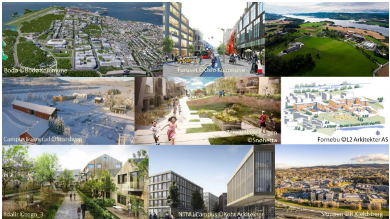
Figur 1 ZEN pilotområder