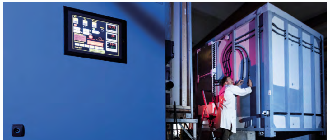
Testing av baderomsmoduler i SINTEFs prøvehall.

Les mer om PBM i Byggforskserien 520.130 Bruk av prefabrikkerte våtromsmoduler. Prosjekterings-hensyn.