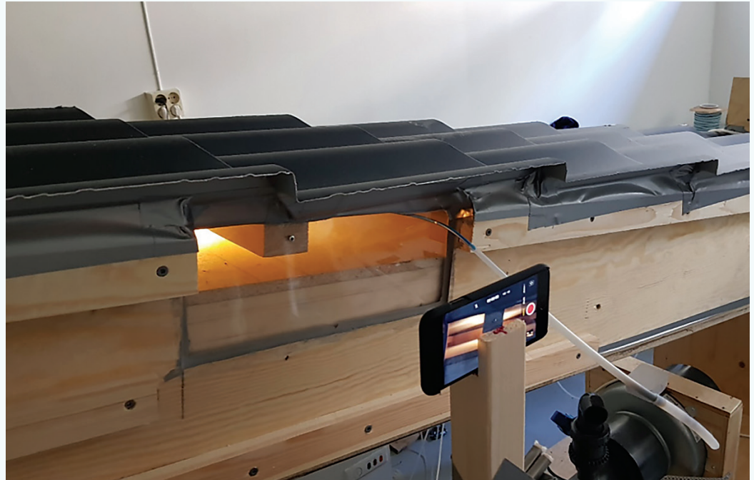
Figur 1: Luftstrømmens forløp under taktekningen er filmet ved hjelp av røyk og spesiell lyssetting.

filmopptak av luftstrømmen viste tydelige forskjeller på rettkantete og justerte lekker. Forsøkene viser at trykktapet i luftespalten minker i gjennomsnitt 30% ved å bytte ut rettkantete lekker med justerte lekker. For noen av situasjonene var trykktapet halvert for justerte lekker sammenlignet med rettkantete. Forskjellen mellom luftstrømmen for de to leketypene er vist i figur 2 og 3. I figur 2 er nedbøyningen av røyken over første hjørne veldig liten sammenlignet med figur 3 hvor nedbøyningen er mer markant. Det kommer også klart frem at luftbevegelsen i figur 3 har flere turbulente strømninger enn i figur 2 hvor strømmen er langt mer laminær.