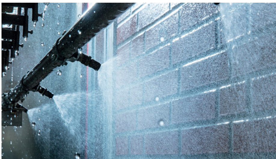
Slagregnprøving av teglfelt før og etter impregnering viser liten effekt av impregneringen på regnmotstandsevnen.

Under oppmuring av teglmurverk vil teglsteinen suge mørtelvann ut av den ferske mørtelen. Mursteins evne til å oppta vann er derfor en viktig parameter siden grunnlaget for heftfastheten i det herdede murverket etableres i løpet av de første minuttene kontakt mellom stein og fersk mørtel. Figur 1 viser mikroskopifoto av heftsoner i teglfelt C. Vi ser her konsentrasjon