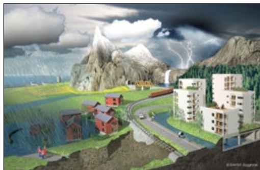
Figur 1. Klima 2050.

demonstrert. Både ekstremvær og gradvise endringer i klimaet vil være i fokus. Klima 2050 søker å være en ledende aktør innen forskerutdanning knyttet til klimatilpasning av det bygde miljø og infrastruktur. Gjennom utdanning av doktorgradskandidater, masterstudenter, og utvikling av høyt kvalifiserte forskere og opplæring av fagfolk i sektoren vil senteret øke kunnskapsnivået i samfunnet knyttet til klimatilpasning relatert til bygninger, infrastruktur og det urbane miljø, figur 1.