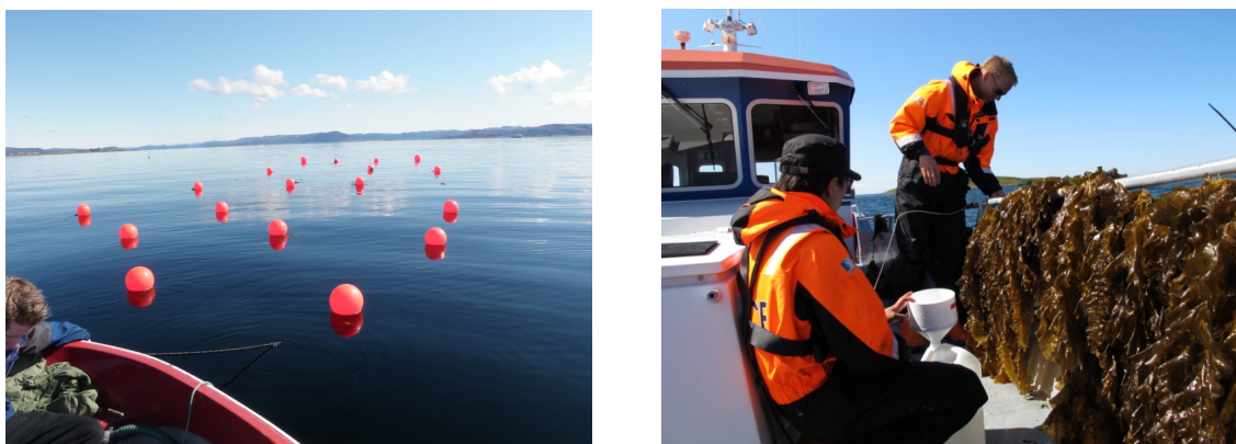
Figur 4. Fra dyrkingsforsøk med sukkertare på Trøndelagskysten.

Gjennom MacroBiomass har vi også etablert et nettverk med verdens fremste FoU-aktørene innen dyrking og anvendelse av tang og tare, bl.a. i Kina, Irland, Skottland, Frankrike, Nederland, Danmark og Island, og som vil være nyttige samarbeidspartnere i nye FoU-prosjekter. MacroBiomass har også vært grunnleggende for at SINTEF har etablert Norsk senter for tang- og tareteknologi, i samarbeid med NTNU. Dette senteret arrangerte høsten 2012 seminaret "Seaweed for biofuel" i samarbeid med Innovasjon Norge og SAMS, med foredragsholdere fra bl.a. Crown Estate, ECN, SES og Statoil og rundt 60 deltagere.