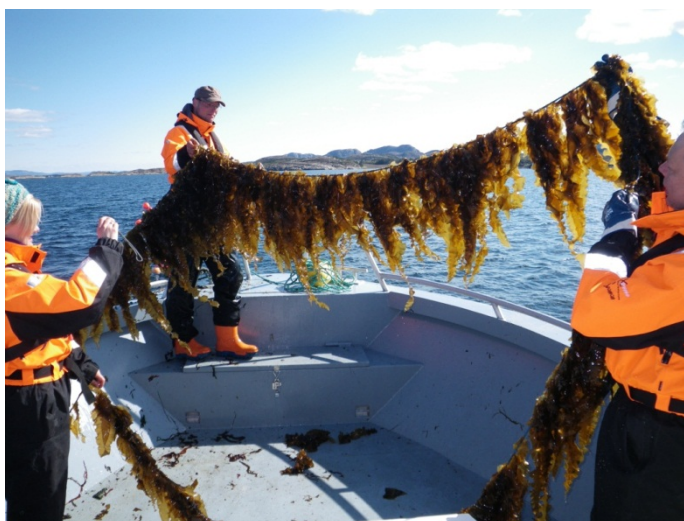
Figur 3. Registrering av vekst i et dyrkingsforsøk med sukkertare på Trøndelagskysten.

MacroBiomass har ikke konvertering til biodrivstoff som en arbeidsoppgave men et samarbeid med biogassprodusenten Frevar KF gjorde at vi kunne utføre et fermenteringsforsøk og sammenligne metanproduksjonen fra dyrket sukkertare med forbehandlet husholdningsavfall. Metanutbyttet fra sukkertare var nesten identisk med utbyttet fra husholdningsavfallet. Beregninger viser at fôring av reaktorene med 10 000 m 3 pr år teoretisk kan gi en energimengde som tilsvarer 4,73 GWh.