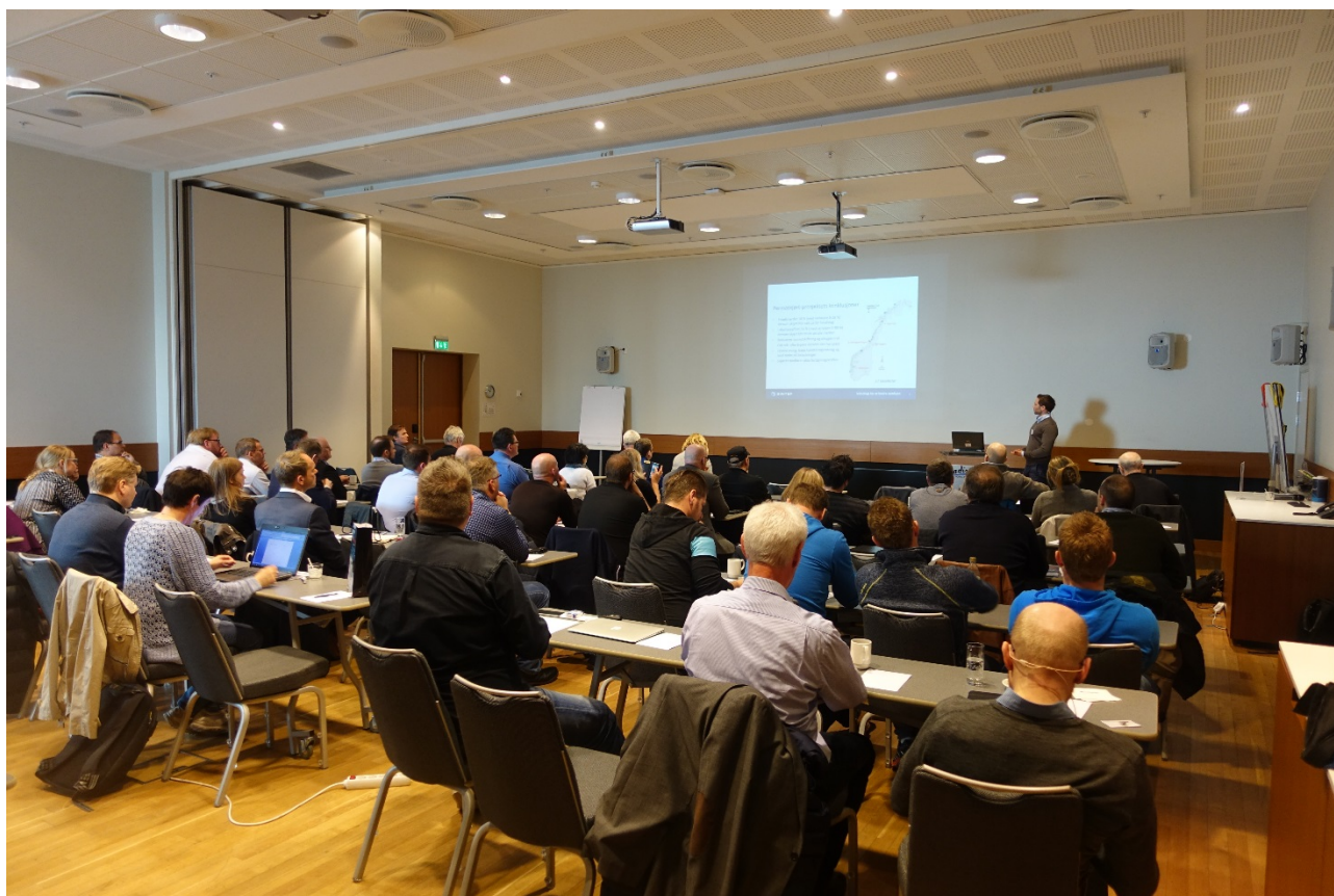
Figur 1. Tilsammen 64 deltakere samlet seg på Radisson Blu Hotel Trondheim Airport for å høre om siste nytt fra bruk av luseskjørt og snorkelmerd for å forebygge lakselusangrep.

Seminaret ble avholdt 31. mars 2016 på Radisson Blu Hotel Trondheim Airport. Programmet for seminaret finnes i Vedlegg A. Det var til sammen 64 deltakere på seminaret, hvorav 44 % var fra selskaper med oppdrettsvirksomhet og 37 % fra utstyrsleverandører (figur 1). Komplette deltakerliste finnes i Vedlegg B.