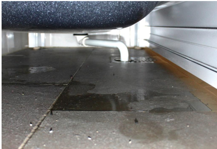
Figur 2: Under løststående badekar kan samles mye vann om ikke der er fall. God avrenning bort fra vegg og på skjulte flater er nødvendig så vannet ikke samles i svanker.

En vanlig lengde på standardkar er 1,6 – 1,8 m, bredden varierer fra 0,7 – 0,9 m. Golvarealet under badekar må bygges med fall mot hoved- eller bisluket. Har man godt fall til hovedsluket så behøves ikke lokalt fall mot sluket under badekaret. Men skal vannsøl fra karet fanges opp av "badekarssluket" må det etableres tilstrekkelig lokalt fall til dette. Er også golvet prosjektert for at karet senere skal kunne fjernes og erstattes med dusjing rett på golvet så må slukplassering og fallforhold være tilrettelagt for det. Uansett løsningsalternativ må fallet være så store at vann under badekaret ikke blir stående.