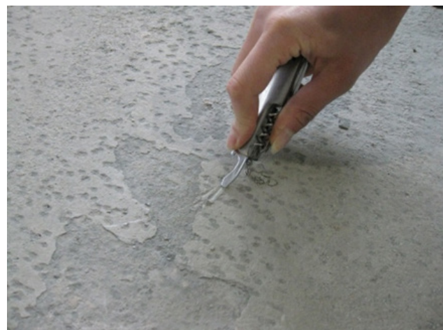
Figur 4: Sementhinne og annen forurensning må fjernes før liming oppstarter.

En støpt flate kan ha en slamhinne på overflaten. Noen betongentreprenører bruker også akrylbasert membranherdner for å dempe uttørringen. I tillegg kan det også samle seg mye skitt og forurensning fra tråkk og aktivitet på byggeplassen og hvor støvsuging alene ikke er tilstrekkelig.