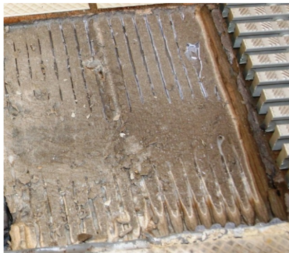
Figur 7: Eksempel hvor flisen ikke er dobbellimt, heller ikke arbeidet godt ned i limet.

Dette er nødvendig av flere årsaker. Man ønsker ikke at vann skal kunne samle seg i riller og hulrom bak flisen. I tillegg trenger man optimal vedheft for å sikre at flisen ikke løsner ved evt. temperatur- og svinnspenninger mellom underlag og fliser.