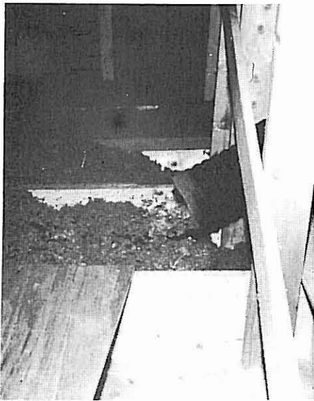
Steinullgranulat blåses inn i himlingen.

blåsingsutstyret som brukes i dag er fast montert på en lastebil. Slangene er lagret på trinser. Innblåsingsmaskinen har 3 innstillinger for regulering av luftmengden. Dette utstyret kan løfte steinullgranulatet omlag 30 m. Arbeidet utføres av to mann – en på lastebilen og en på loftet. Den som arbeider på loftet styrer innblåsingen samt av og på.