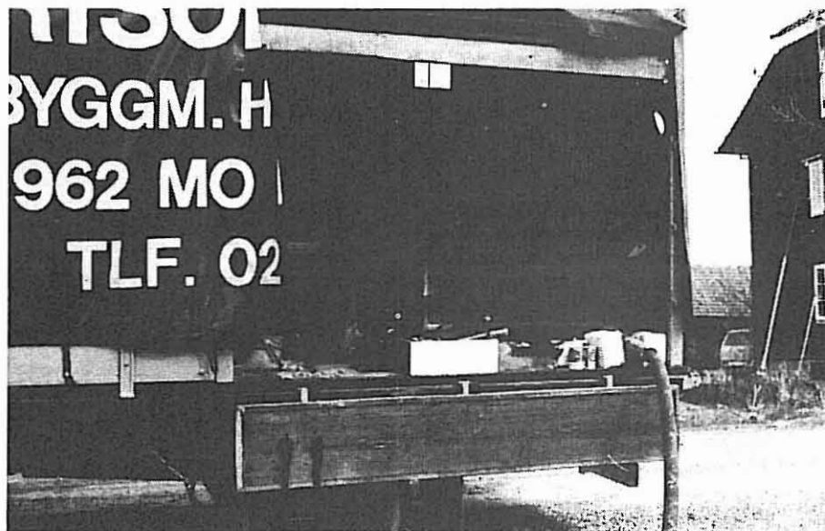
Lastebil med innblåsingsmaskin i bakre del. Fremme er granulattsekkene lagret.

– Hvem utfører arbeidet? Kan andre gjøre det bedre? Kan andre gjøre det rimeligere?